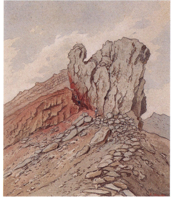
23-[5] 富士山頂釈迦ノ割石之図