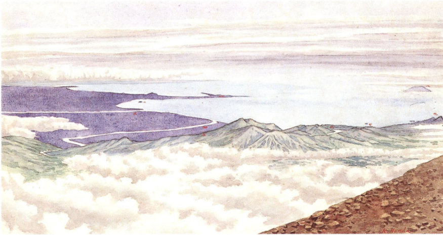
23-[8] 富士山頂ヨリ東南ヲ望ム図