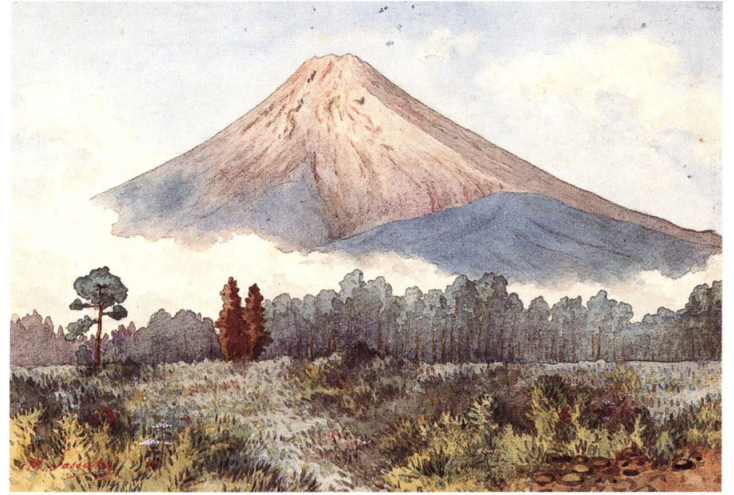
23-[1] 甲州南都留郡福地郷ヨリ富士山北面ヲ望ム図