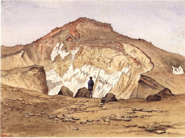
23-[6] 富士山頂剣ヶ峰之図