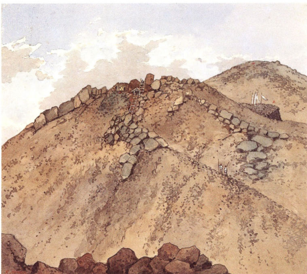
23-[7] 富士山頂駒ヶ岳之図