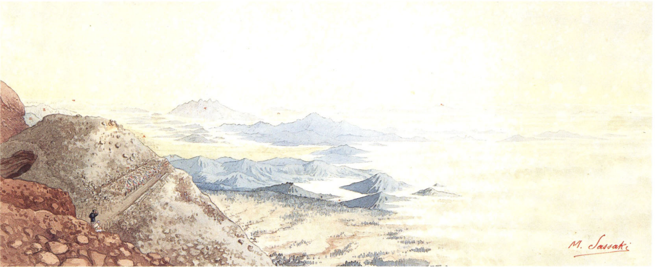
23-[11] 富士山頂ヨリ北方ヲ俯瞰スル図