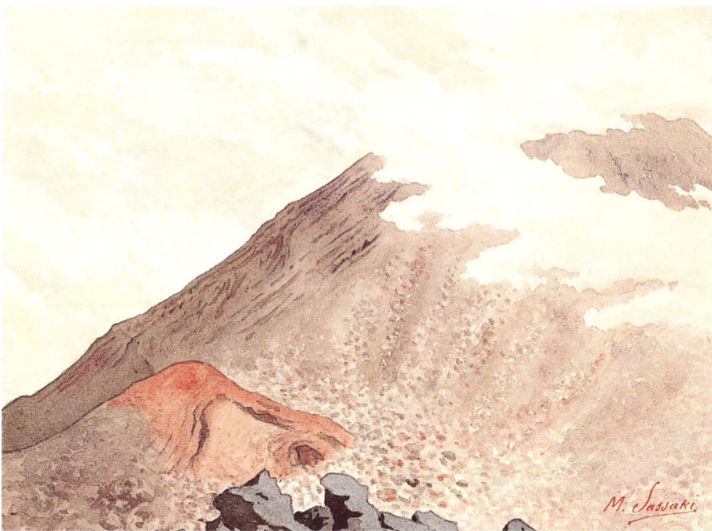
23-[13] 宝永山噴火口之旧跡