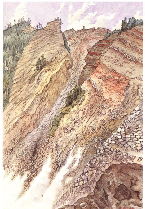
23-[10] 富士山西方ノ谷間大澤之図