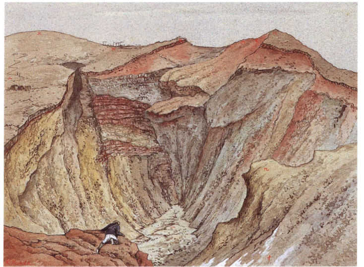
23-[3] 富士山頂之図 甲