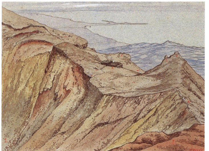
23-[4] 富士山頂之図 乙