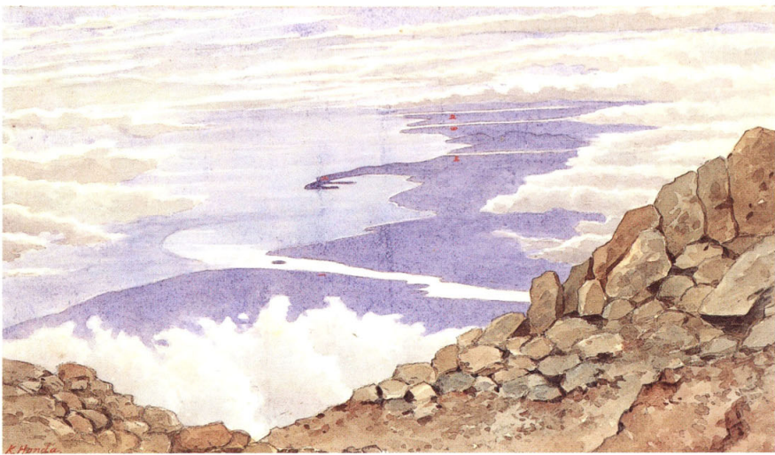
23-[9] 富士山頂ヨリ西南ヲ俯瞰スル図