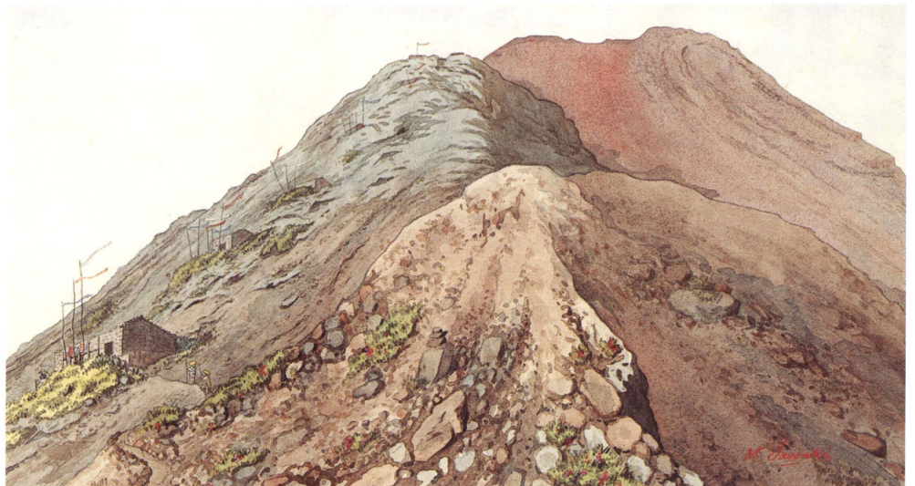
23-[2] 富士山北口登道六合目ヨリ山頂ヲ望ム図